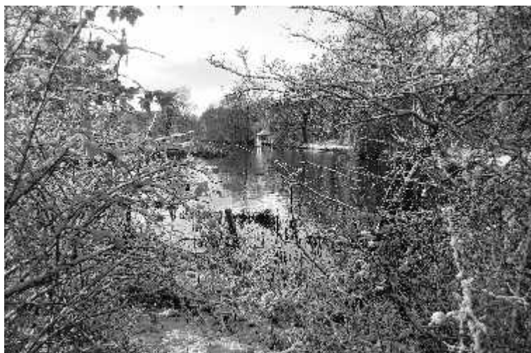
Vinter ved Susåen set mod syd fra krigshavnen